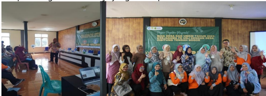
Gambar 3.1 Dokumentasi Pelaksanaan Pelatihan

Pelatihan ini akan memberikan keterampilan kepada pengelola BUMDES di desa pusat Cibitung, mulai dari mengubah ide menjadi konsep bisnis, melakukan validasi bisnis, menyusun rencana bisnis, dan mengubahnya menjadi bisnis, rencana tersebut menjadi bisnis. Salah satu metode untuk memfasilitasi transmisi ide dan ide bisnis adalah Business Model Framework (BMC), karena membangun bisnis komoditas di pedesaan saat ini membutuhkan seorang visioner, melihat ke depan dan berinovasi dalam proses pembangunan. Kekuatan BMC adalah mampu menggambarkan ide bisnis dengan sangat jelas di atas kanvas (kertas). Dengan demikian, Anda dapat menginterpretasikan, memvisualisasikan, mengevaluasi, bahkan mengubah model bisnis Anda sehingga Anda dapat menghasilkan kinerja yang lebih optimal.